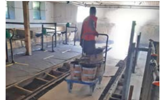
Kurze Bauzeit – Gussasphalt kühlt rasch ab und ist nach wenigen Stunden wieder begehbar